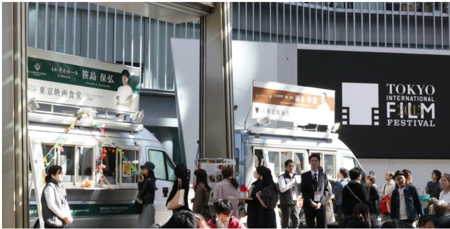
東京映画食堂 (日本の食イベント)