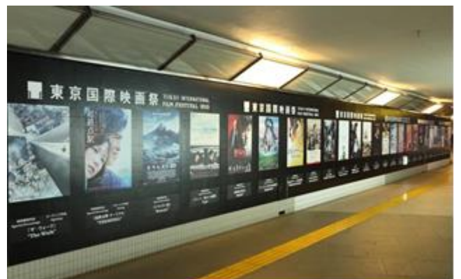
東京メトロ 六本木駅 連絡通路