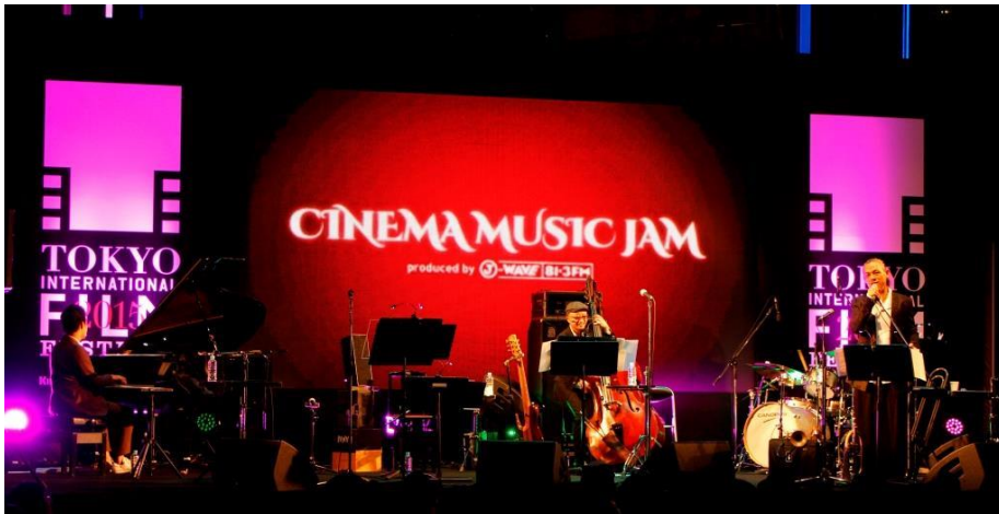
CINEMA MUSIC JAM (映画音楽イベント)