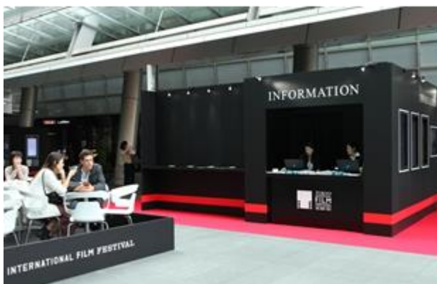
インフォメーションカウンター