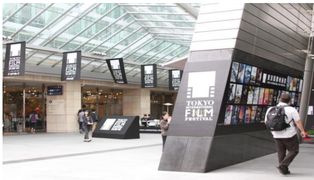
大屋根の TIFF コミュニティ広場