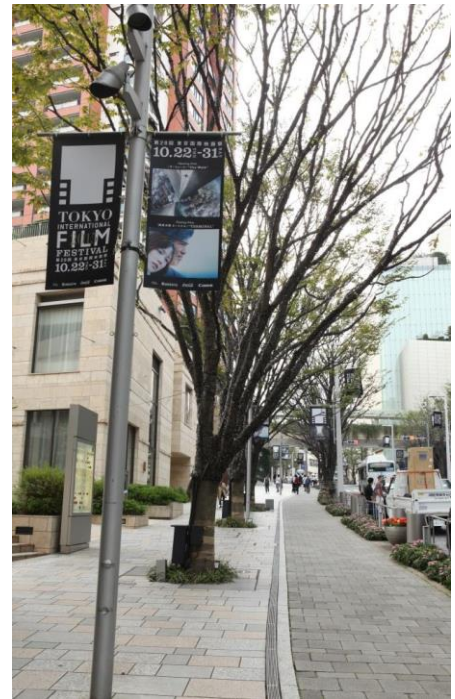
六本木けやき通り