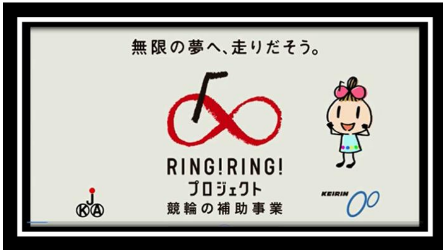
②TOHOシネマス ® 六本木シネマス ® 上映時 (上映前の先付) ©2013TIFF