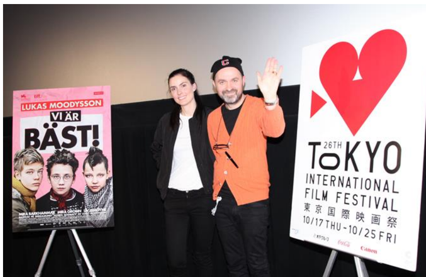
④上映時Q&A 東京サクラがランプリ 受賞作『ウィ・アー・ザ・ ベスト!』 ルーカス・ムーディソン(監 督) コム・デ・イソン(原作)