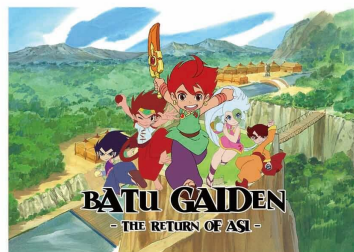
Batu Gaiden (2013)