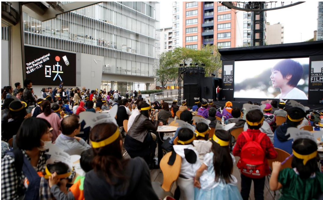
六本木ヒルズアリーナで、誰もが楽しめる野外無料上映を実施