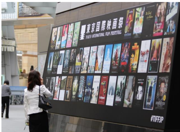
大屋根プラザ Tiffコミュニティ広場