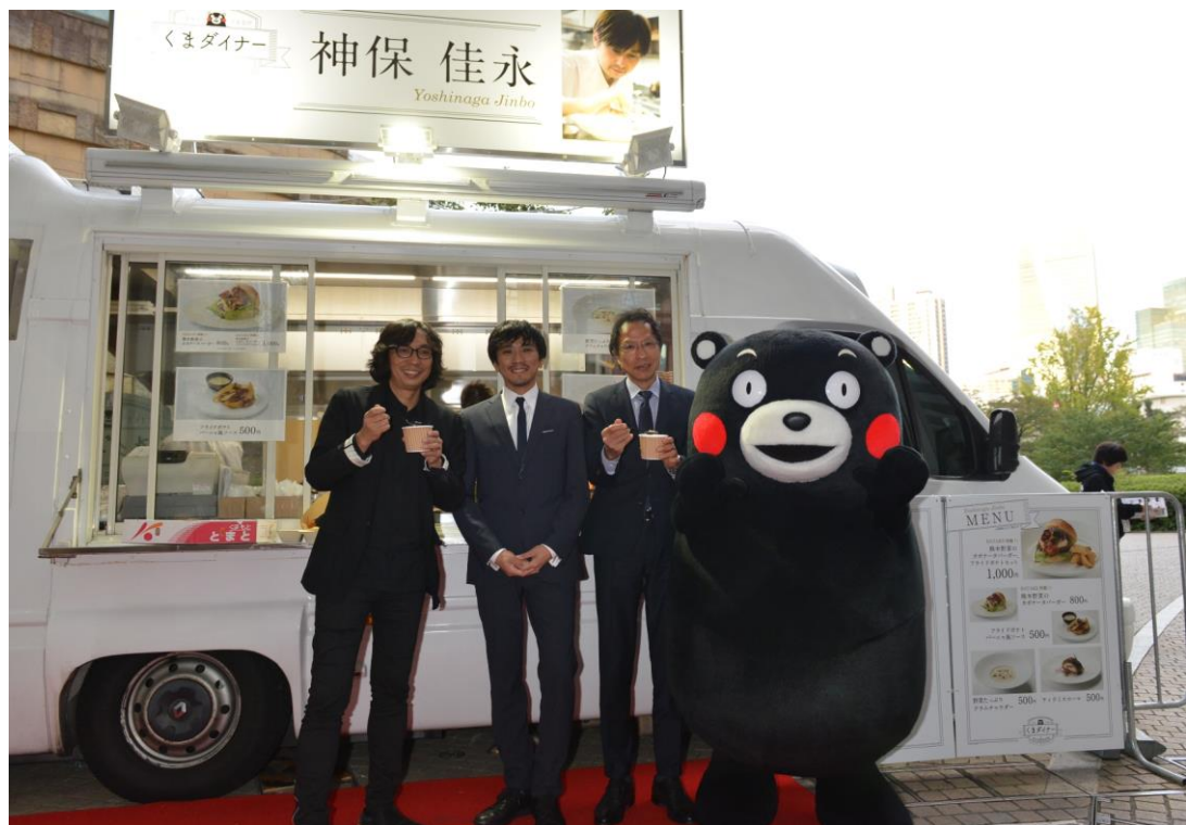
「“元気な熊本”を東京へお届けしたい！」という想いのもと、六本木ヒルズアリーナにて、トップシェフによる熊本の食材を使用したオリジナルフードコーナー「くまダイナー in 東京国際映画祭」を出店 左から 行定勲(監督) 米村亮太郎(俳優) 姜尚中(政治学者) くまモン