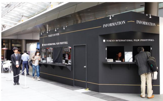
インフォメーションカウンター